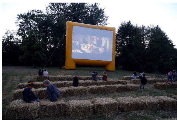
Cinéma Plein Air au Parc Nature en partenariat avec le Comité des Fêtes

ASSEMBLEE GENERALE : mardi 4 février à 20h30 Relais St Germain