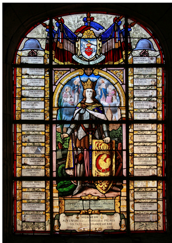
Vitrail central de l'église Saint Germain