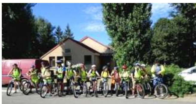
Départ du Camp théâtre Itinérant

Lien : http://theatre-bascule.fr 9 rue de la Madeleine PREAUX DU PERCHE